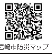
宮崎市防災マップ

※避難ルートの検討の際は、他の防災マップ(土砂災害、洪水、津波)も参考にしてください。