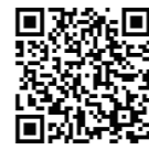
宮崎市防災マップ

※避難ルートの検討の際は、他の防災マップ(土砂災害、洪水、津波)も参考にしてください。