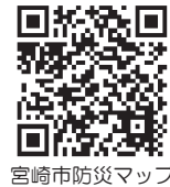
宮崎市防災マップ

※避難ルートの検討の際は、他の防災マップ(土砂災害、洪水、津波)も参考にしてください。