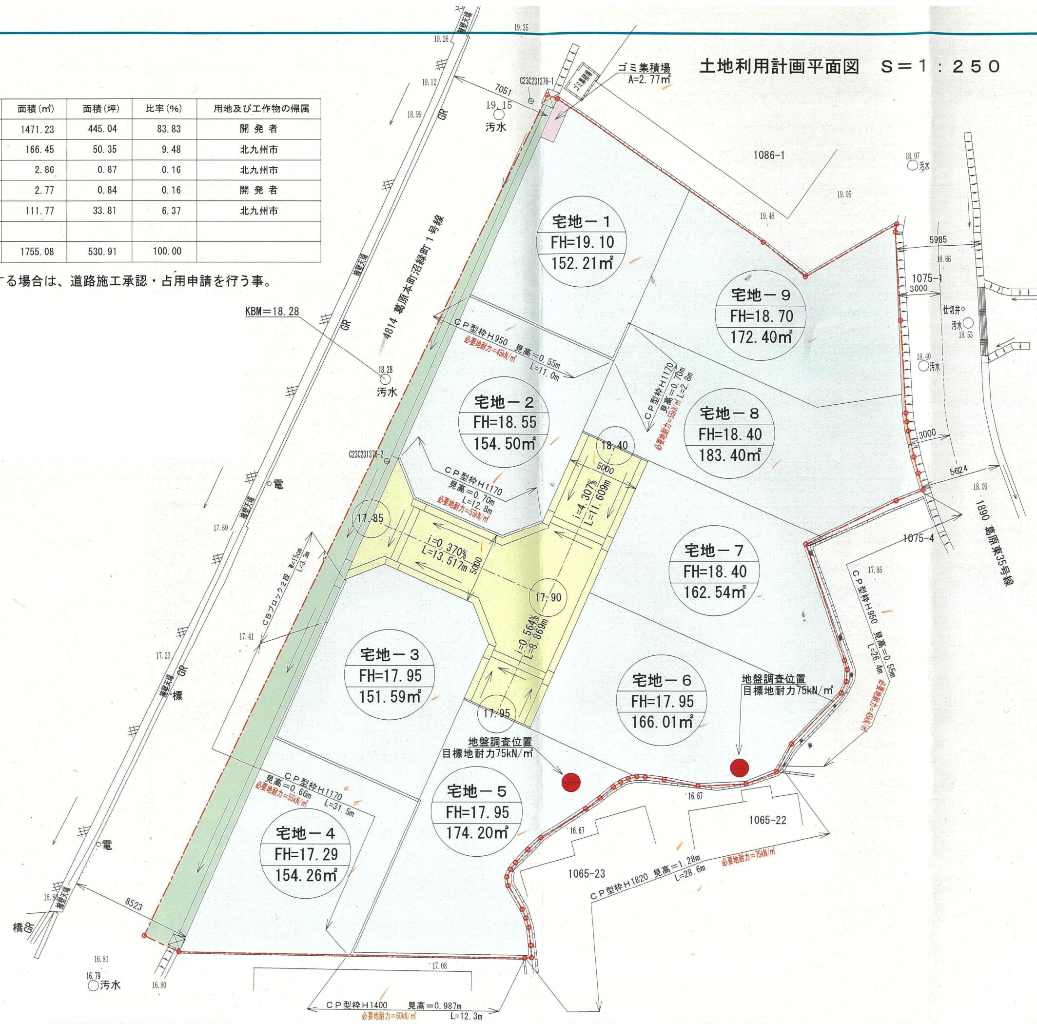
土地利用計画平面図 S=1:250