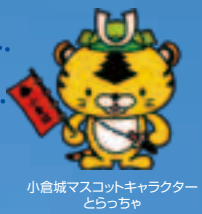
小倉城マスコットキャラクター くらっちゃん