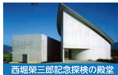
西堀榮三郎記念探検の殿堂