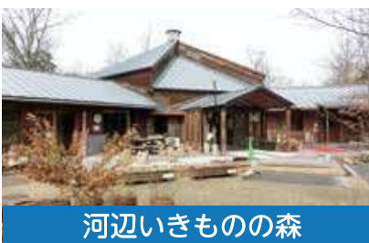
河辺いきものの森