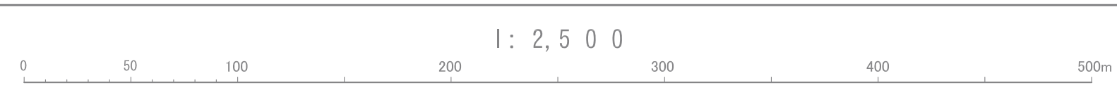
図 縮尺 1:2,500 等高線間隔 2m この図面は、平成22年度に国土基本図測図に改定したものである

平成22年測量 平成29年修正 (1) 1.平成20年度測量 平成20年8月撮影 2.平成20年度測量 平成20年8月撮影 3.平成20年度測量 平成20年8月撮影 (2) 1.平成29年5月撮影 2.平成29年12月現地調査 3.平成30年1月測図