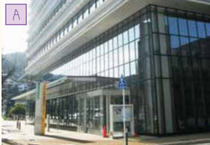
中央保健福祉センター (すこやかプラザ)