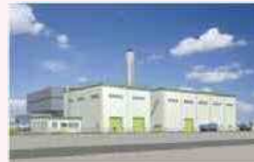
<下水汚泥燃料化センター>