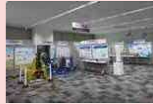
<3階 技術・製品展示>