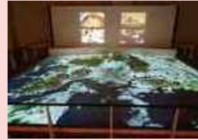
<2階 下水道学習フロア>