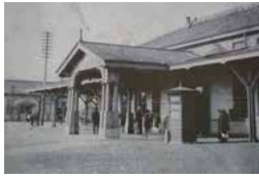
「ちくほう絵葉書浪漫」より

石炭産業盛んなりし頃の筑豊、直方を訪れた松本清張や林芙美子達が目にした情景とは。