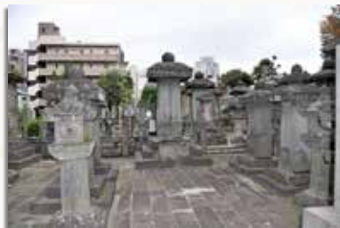
高政公と殉死者の墓碑 (東京都渋谷区の祥雲寺墓地)

並びの序列は年齢順ではなく役職・禄高によるものと思われる肖像画でも前列と後列では服装が異なります。