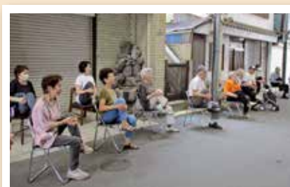
いつまでも歩けますように