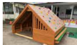
寄贈されたサステナハウス(清光寺幼稚園)