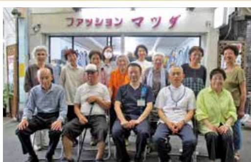
目印はファッションマツダ

発足 令和5年6月 とき 毎週火曜日 午後2時～ ところ ファッションマツダ前（須崎町アーケード内） 参加人数 15人前後 年齢構成 50代～90代