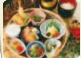
北九州の美味しい食事付き (写真はイメージ)