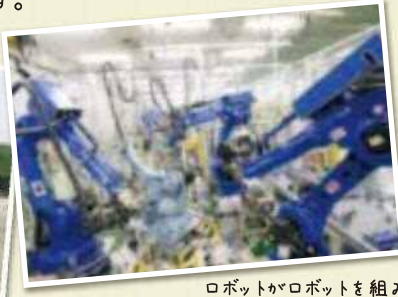
ロボットがロボットを組み立て (株)安川電機ロボット工場