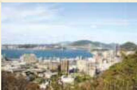
①風頭から見渡す景色が最大の魅力。遠くに関門海峡が望め、晴れた日は大分県の由布岳や鶴見岳なども見えます。

JR小森江駅→風師山小森江口→風師山→風頭→風師山展望台 →清滝公園→JR門司港駅