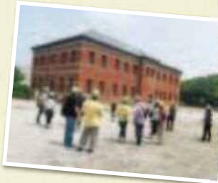
世界遺産・官営八幡製鐵所 旧本事務所の内部見学ツアー