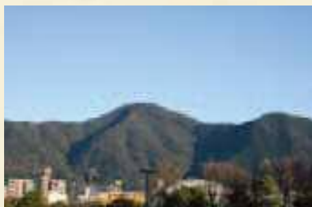
①九州百名山のひとつ。足立山から門司区の戸ノ上山、風師山へと続く企救自然歩道も整備されています。