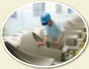
TOTO発祥の地 小倉第一工場

個人では入れない工場や施設へご案内する北九州ならではの体験型観光です。官営八幡製鐵所でお馴染みの新日鐵住金(株)八幡製鐵所や、トイレでお馴染みのTOTO(株)は北九州が創業の地です。また、産業用ロボットで世界シェアNo.1の(株)安川電機など多くの企業が集積しており、ものづくり産業観光にはうってつけの地域です。