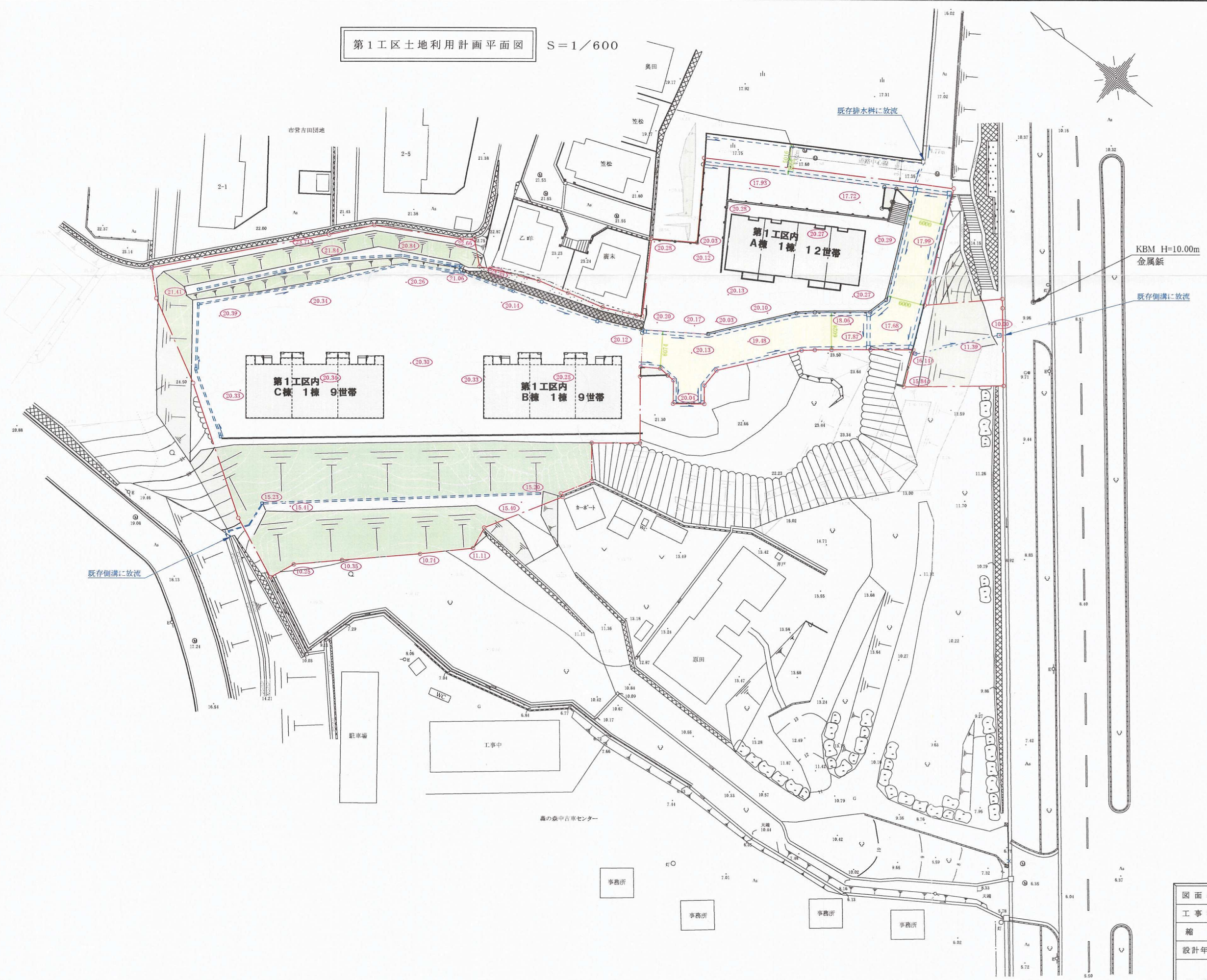
第1工区土地利用計画平面図 S=1/600