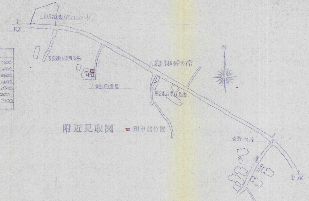
附近見取図 印申請位置