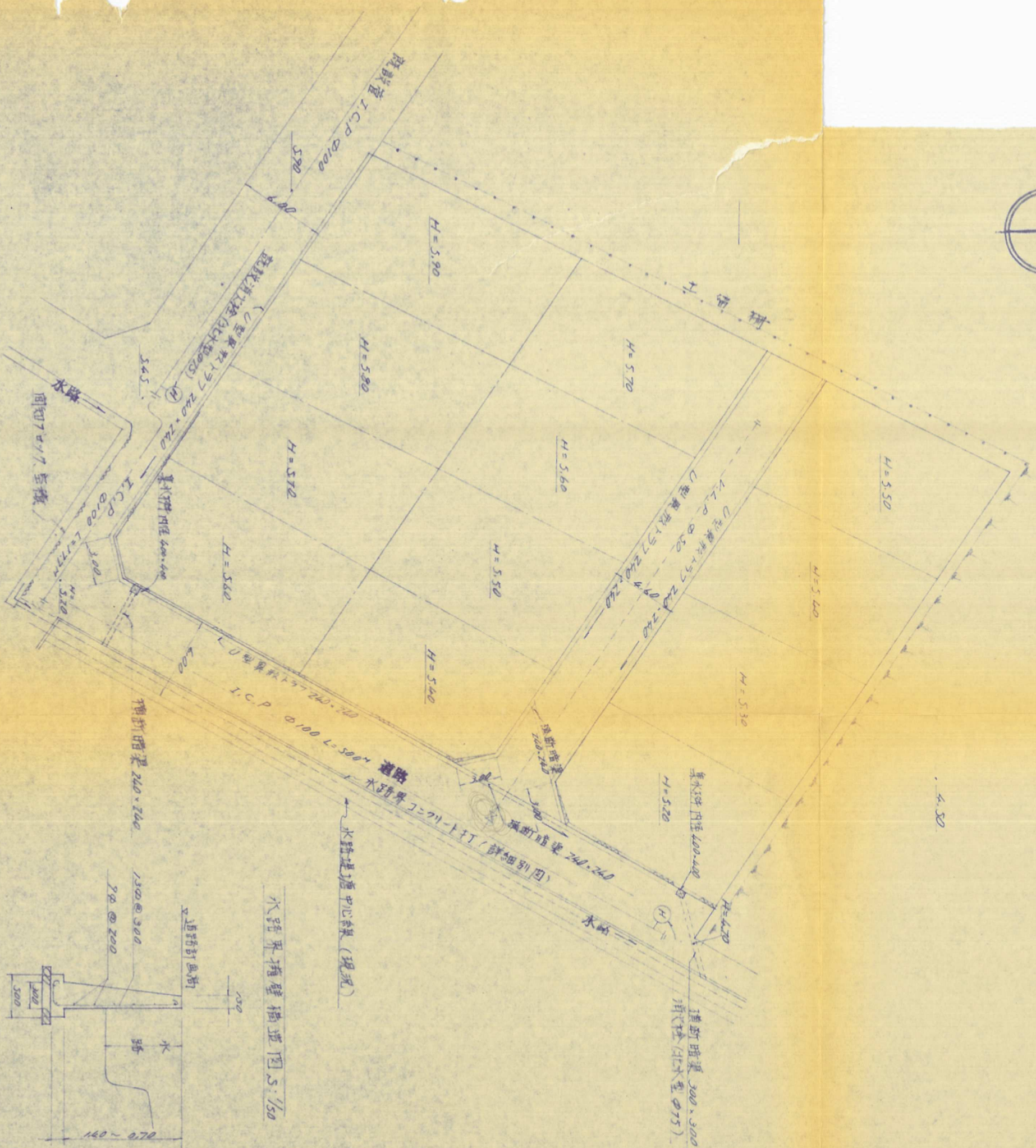
水路界擁壁構造図 S:1/50