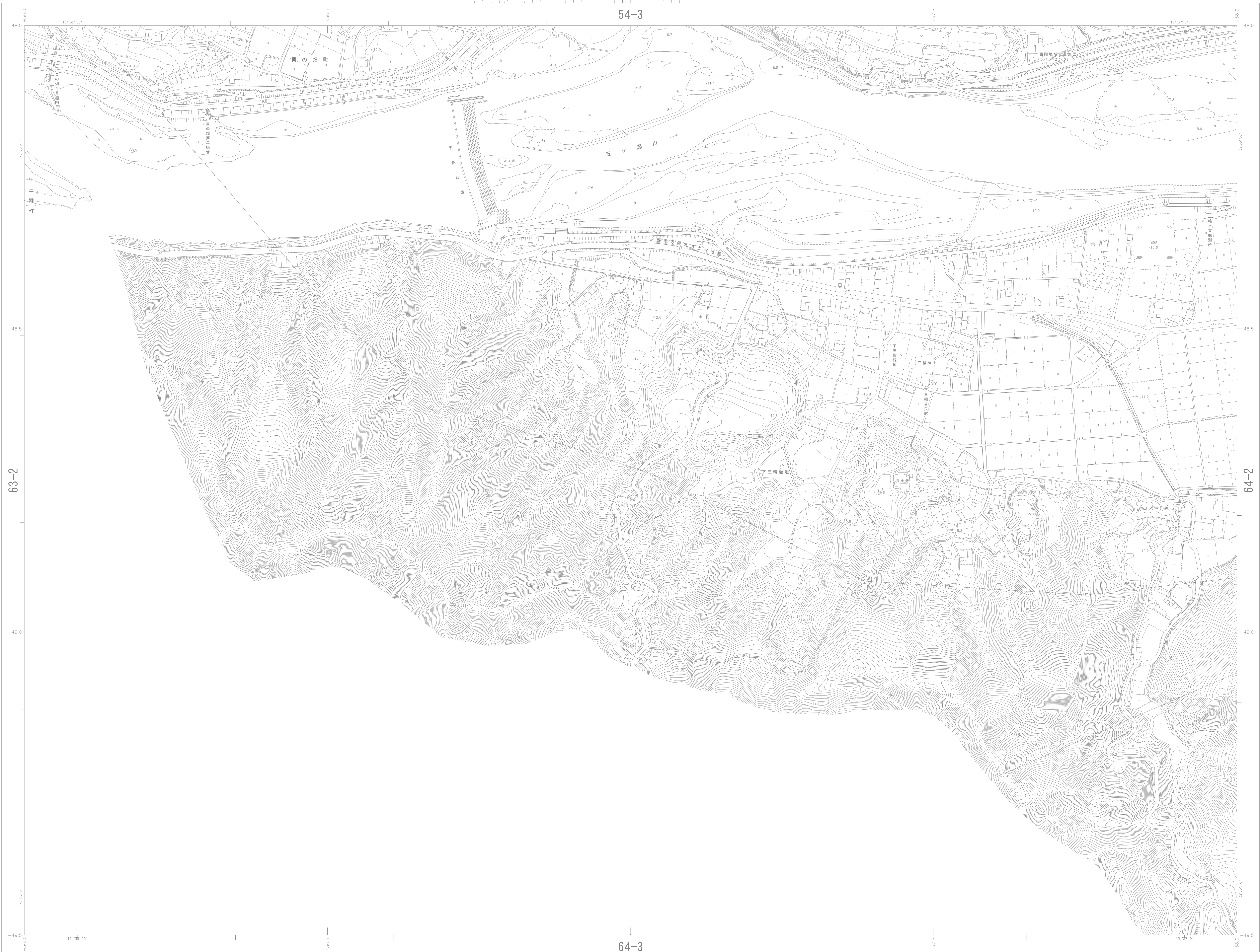
42 II-LF 64-1