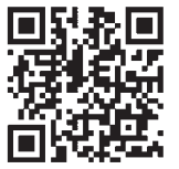
↑ホームページはこちら

【対象】 市内に6カ月以上居住している方。500区画程度 【料金】 使用料・年間管理料必要 【受付】 来年3/10(木)まで 【案内】 ホームページ・区役所情報コーナー・同園(緑区鳴海町) ☎876-9877 FAX877-0542