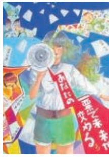
昨年度の県入選作品

【ポスター】 四つ切りか八つ切り画用紙使用。裏面右下に区名・学校名・学年・氏名(ふりがな)を記入 【対象】 小学生～高校生