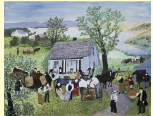
アンナ・メアリー・ロバートソン「グランマ・モーゼス(農場の引越)」 1951年 個人蔵(ギャラリー・セント・エティエンヌ、ニューヨーク寄託)

モーゼスおばあさん(グランマ・モーゼス)の愛称で親しまれた、モーゼスの代表作日本初公開! 無名の農婦だったモーゼスは70代で本格的に絵を描き始め、80歳の時にニューヨークで初個展を開きました。たくましく誠実に101歳まで生きたモーゼスの"素敵な100年人生"の世界を、作品と愛用品などを含めた約130点で紹介します。